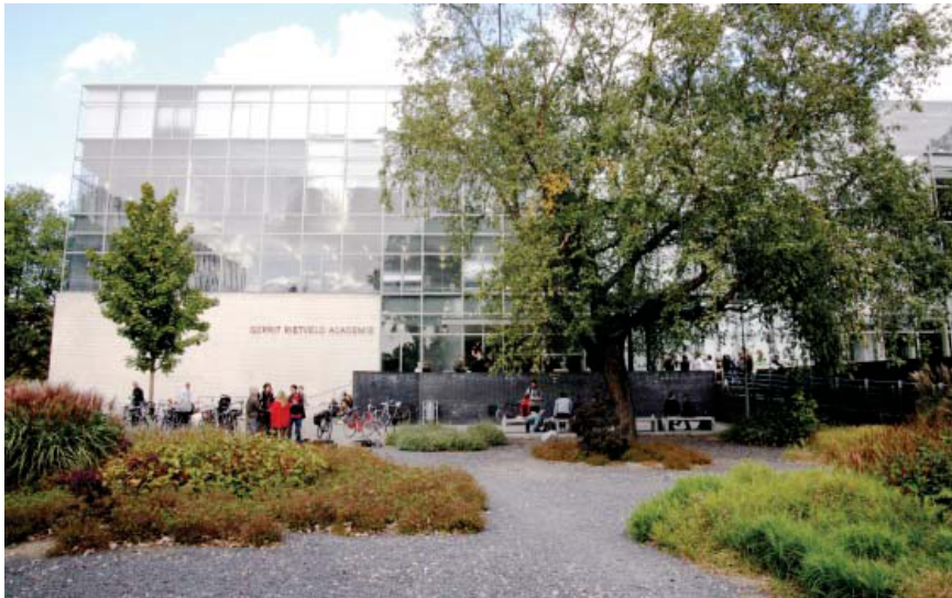
Gerrit Rietveld Academie

in het ene lokaal en dan van 1 tot 5 in het andere, met je mapje verhuizen... Aan tafeltjes van 50 bij 65, want groter werd er niet gewerkt.